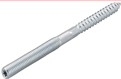
Kannatuspultti STST terävällä päällä